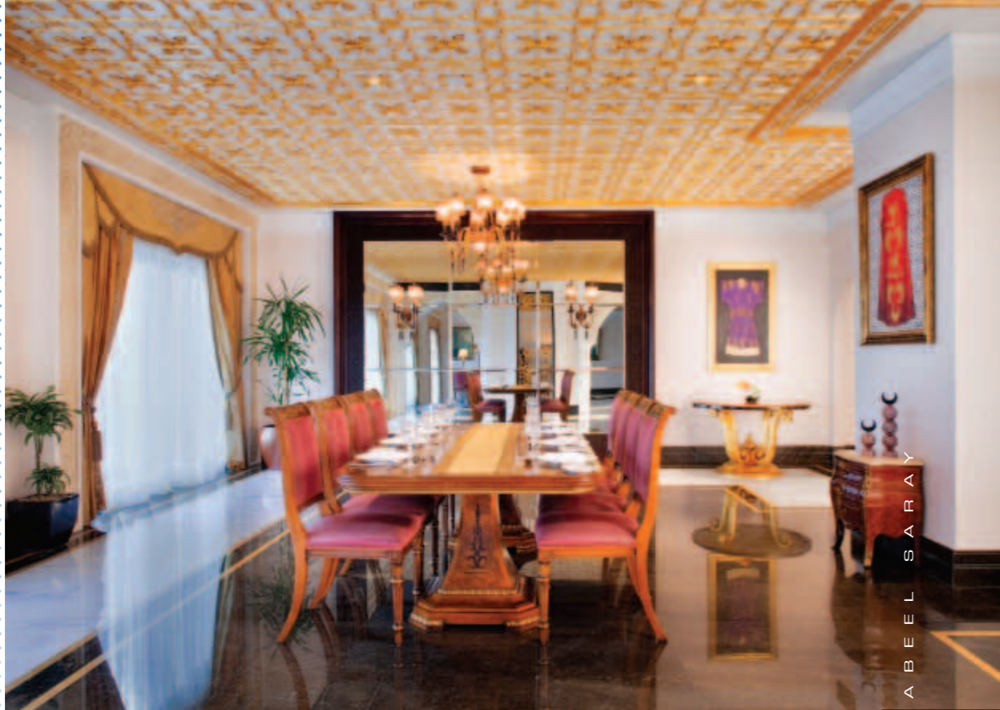
J U M E I R A H Z A B E E L S A R A Y