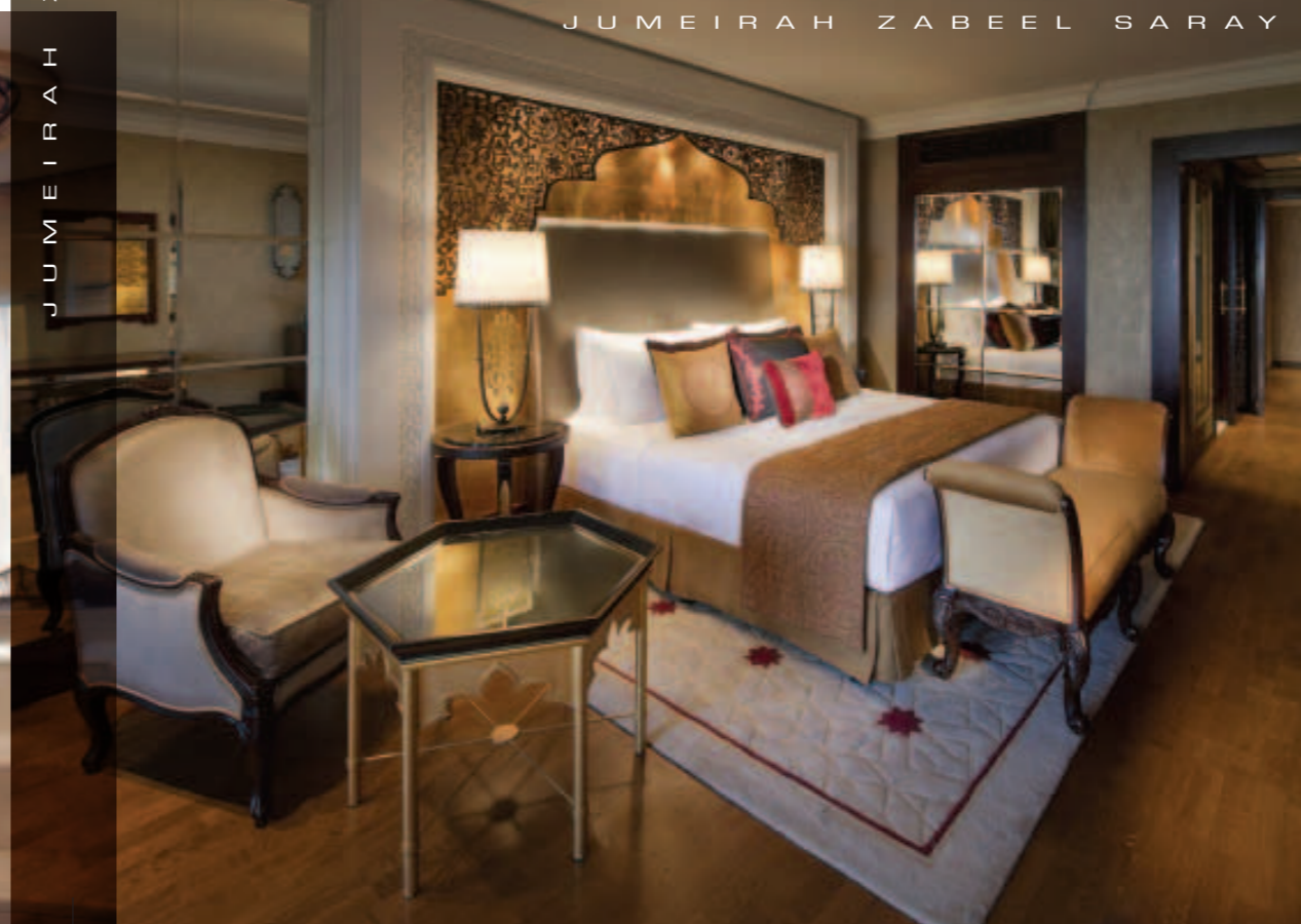
J U M E I R A H Z A B E E L S A R A Y