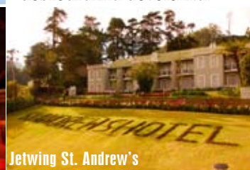
Jetwing St. Andrew's