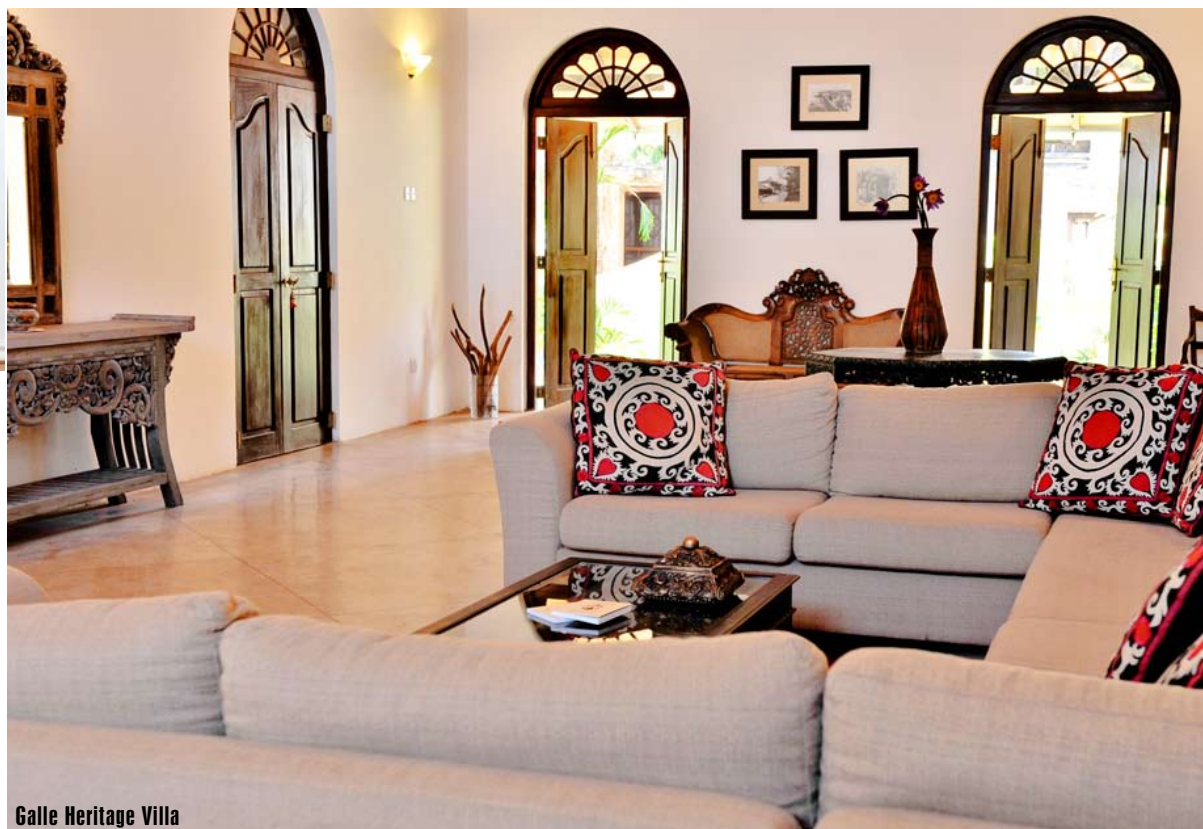
Galle Heritage Villa

A k túžite po privátnejšom ubytovaní v pravom koloniálnom štýle, Srí Lanka ponúka hneď niekoľko možností. Galle Heritage Villa je luxusná vila, situovaná v srdci Galle Fort (na zozname UNESCO), v holandskom koloniálnom štýle a môže sa pochváliť štyrmi elegantne zariadenými deluxe izbami.