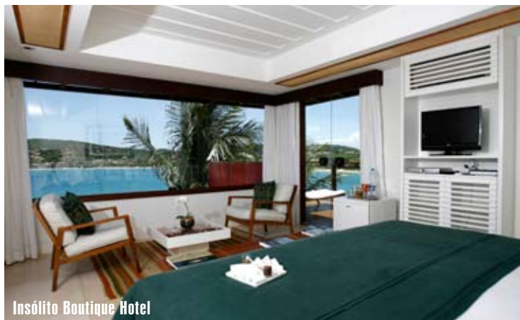
Insólito Boutique Hotel