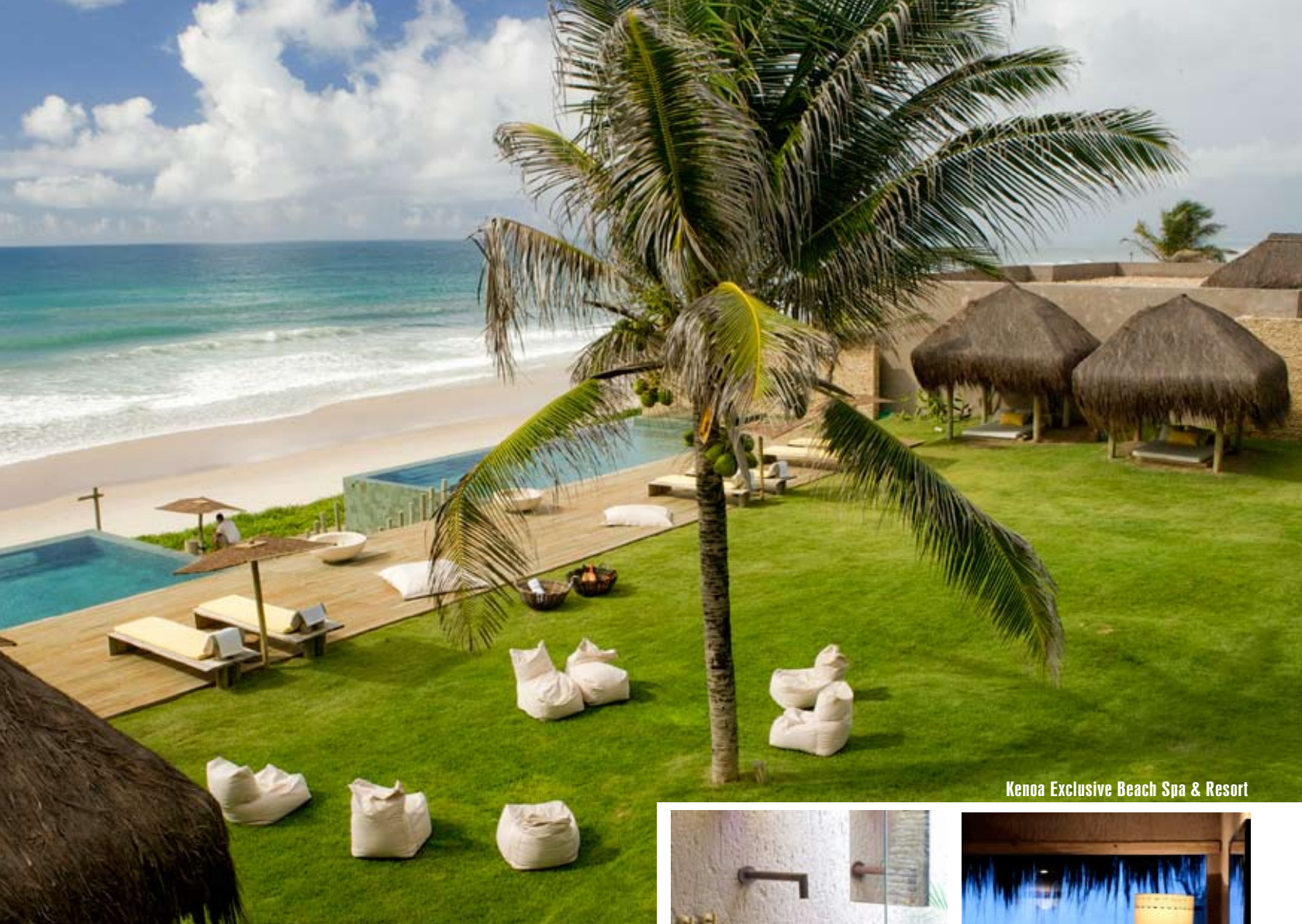
Kenoa Exclusive Beach Spa & Resort

iných vymoženostiach hostí nadchne jeden z najluxusnejších bazénov v Riu - s takmer olympijskými rozmermi. Úžasným benefitom je, samozrejme, skvelá Copacabana so širokou paletou možností pre milovníkov vodných športov vo výnimočnej atmosfére mestskej pláže so všetkými atrakciami, ktoré k nej patria.