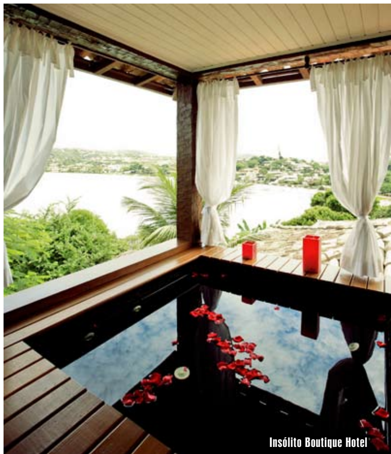
Insólito Boutique Hotel

Magic Travel 02/4444 1130 magic@magictravel.sk www.magictravel.sk