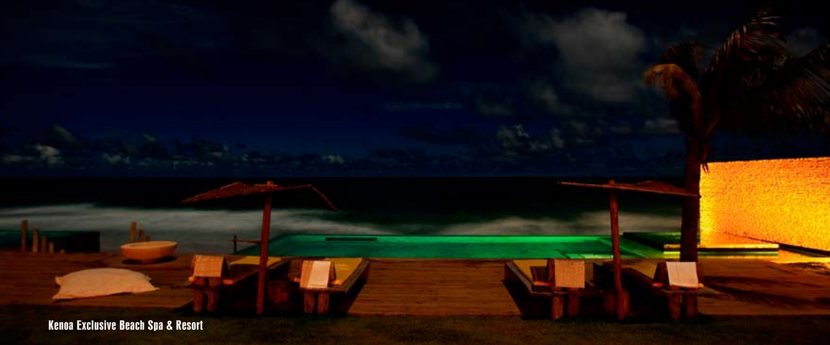
Kenoa Exclusive Beach Spa & Resort

B olesti v dolnej časti chrbta, ktoré som cítil už mesiace, zázračne zmizli a po dlhých rokoch som sa znova cítil poriadne odpočínutý.“ Na hostí tu čaká pokoj, relax a vynikajúce služby, s ktorými