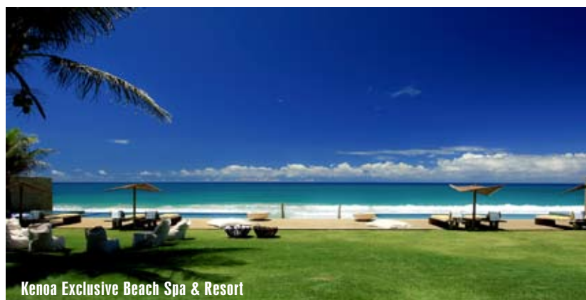
Kenoa Exclusive Beach Spa & Resort