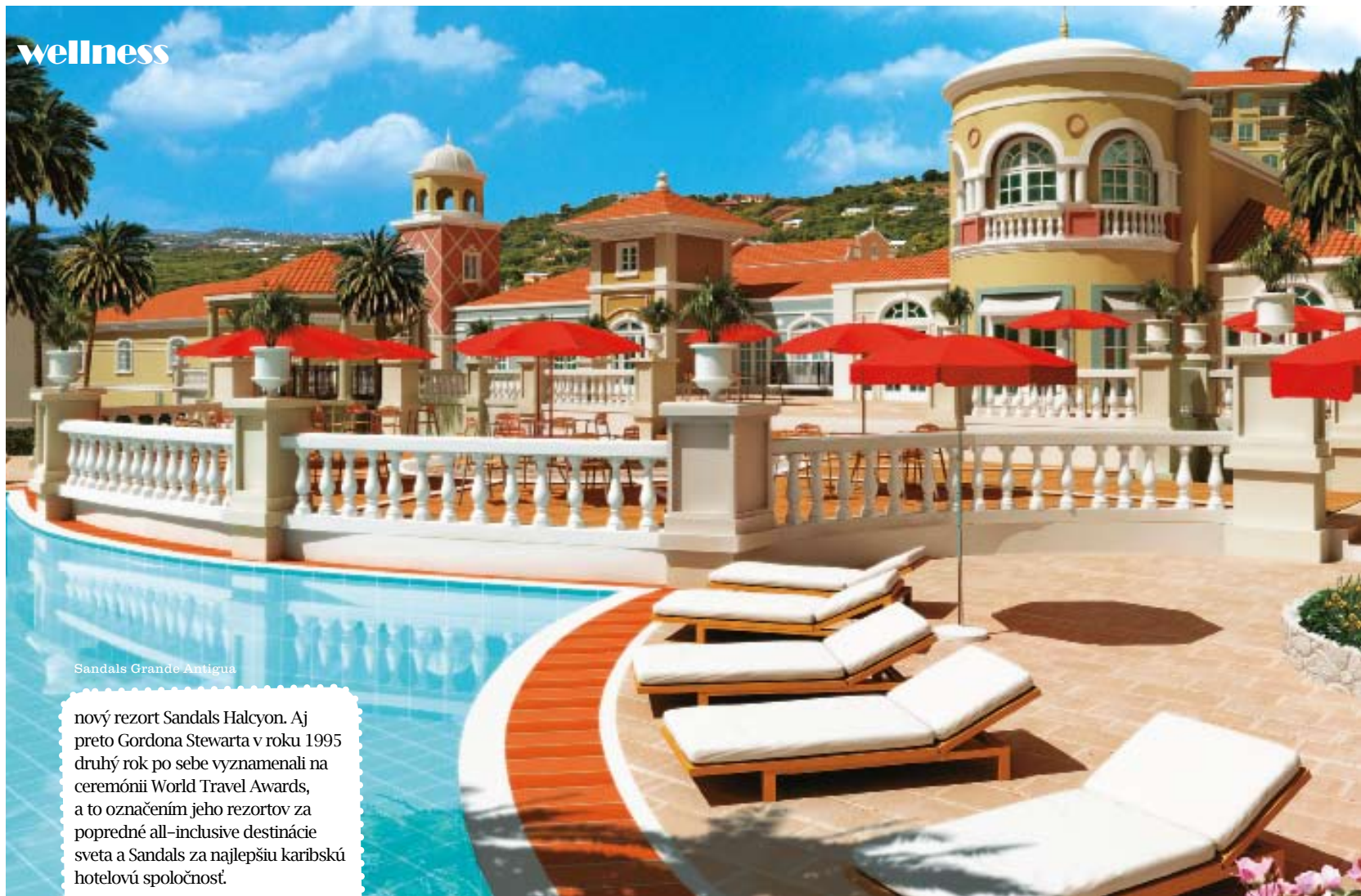
Sandals Grande Antigua