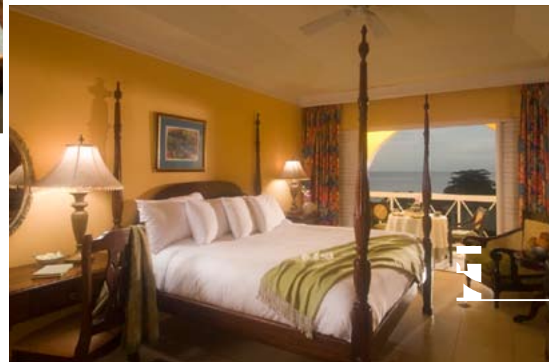
Sandals Regency St. Lucia

Od roku 1984 si svoje „áno“ v rezortoch Sandals povedalo viac ako osem tisíc párov, a tak nastal čas na čosi nové, špeciálne. Sandals ponúkol balíček svadobných služieb „Wedding Moons“. K Sandals St. Lucia navyše pribudol