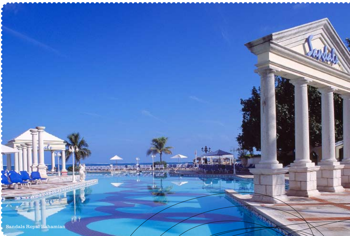
Sandals Royal Bahamian

Rezorty Sandals sú určené pre páry, a tak každý, kto túži milo prekva-