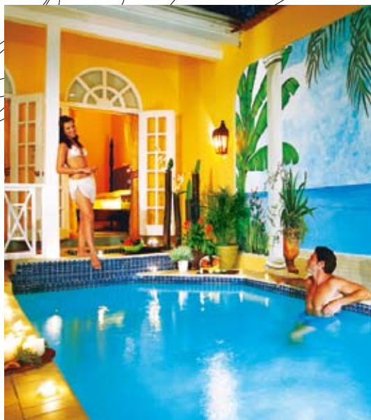
Sandals Grande Ocho Rios

Vďaka širokej ponuke gurmánskych špecialít, vodných športov, vynikajúcemu ubytovaniu, servisu a personálu začali rezorty Sandals označovať „ultra all-inclusive“ (1993). To však