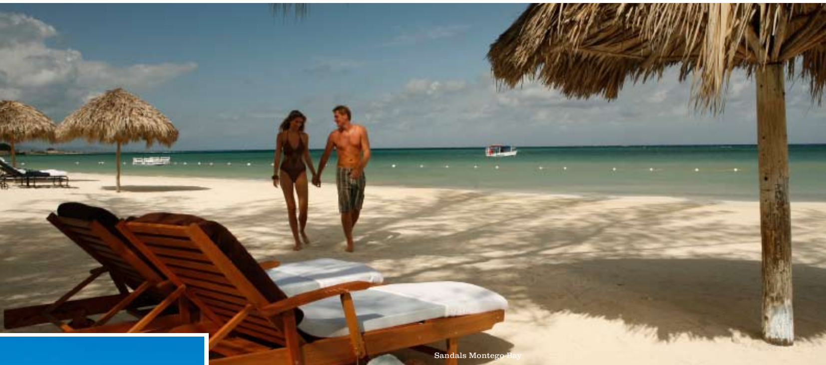
Sandals Montego Bay