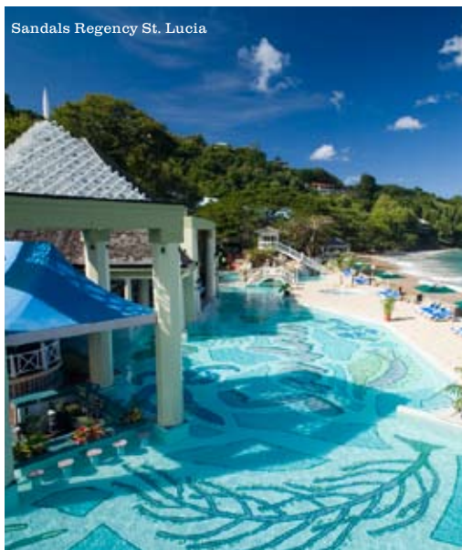
Sandals Regency St. Lucia