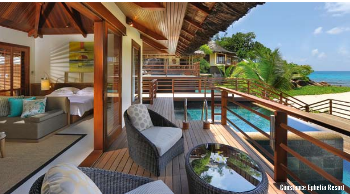
Constance Ephelia Resort

ber Sainte Anne Resort & Spa. Tento plne all inclusive rezort sa rozprestiera na ploche 220 hektárov súkromného ostrova v Indickom oceáne, v srdci unikátneho morského parku. Ubytovanie sa nachádza v súkromných vilách v tropickom pralese a preslávil sa aj svojimi vynikajúcimi službami a gastronómiou. Hotel má tiež kúpele s kozmetikou Clarins.