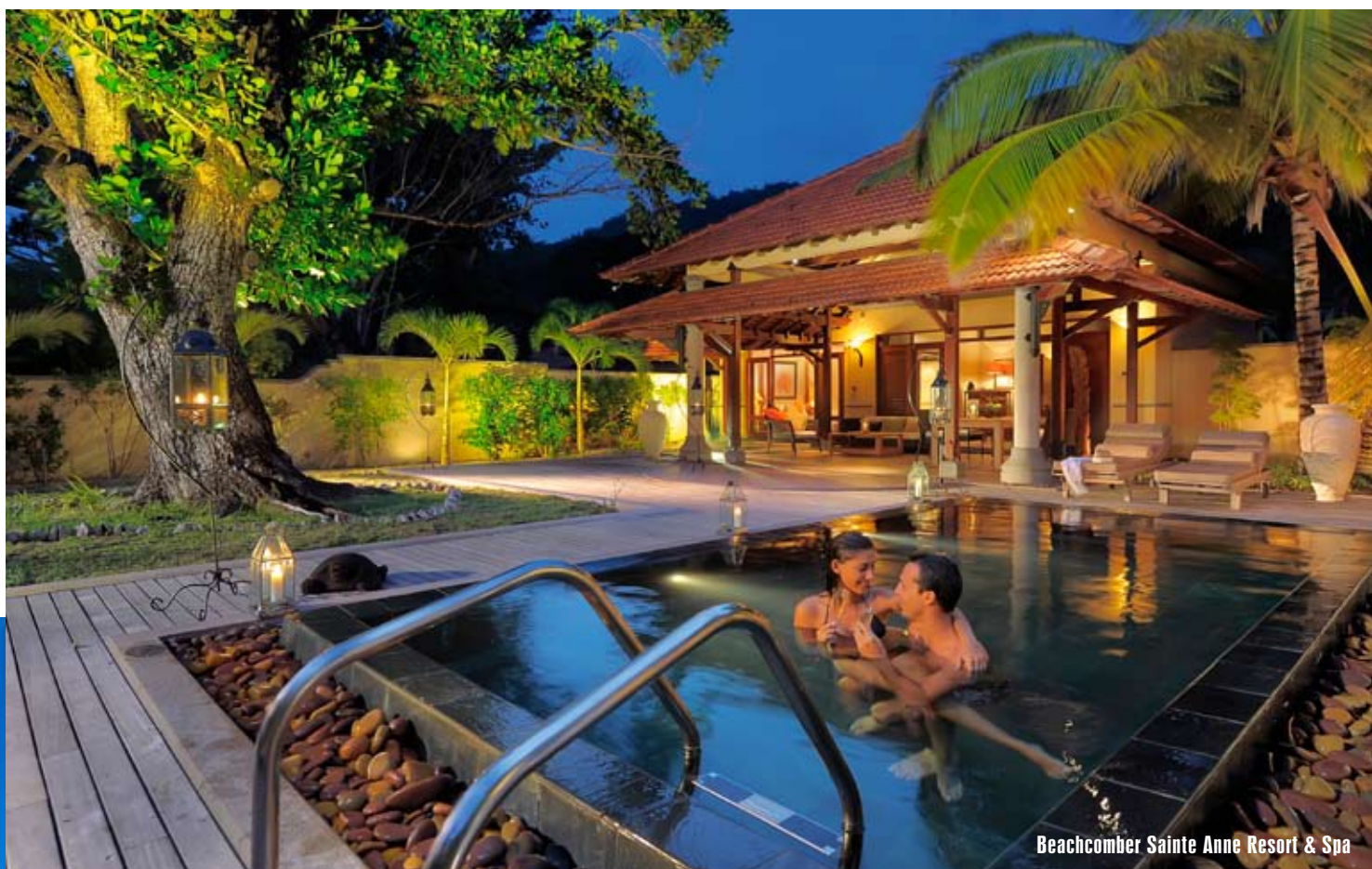
Beachcomber Sainte Anne Resort & Spa